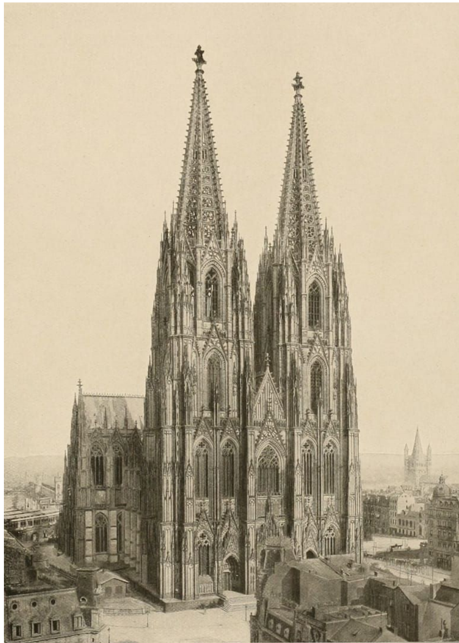
KOLN a. Rh. Der Dom. - COLOGNE. The Cathedral. - COLOGNE. La cathédrale.