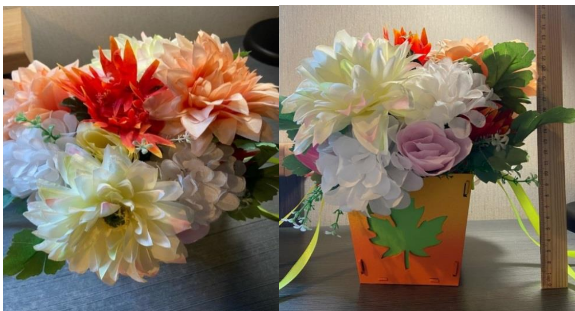
Рис. 4. Композиция №2

Поставленные в проекте задачи: рассмотрение математических понятий, используемых при составлении цветочной композиции и изучение различных способов составления флористических букетов с применением математики – успешно решены. Мы убедились, что математические принципы и законы применяются во флористике.