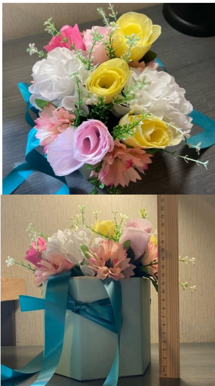
Рис. 3. Композиция № 1

У нас вышло: высота коробочки – 12 см, высота цветка – 8 см, общая высота композиции – 20 см (рисунок 3).