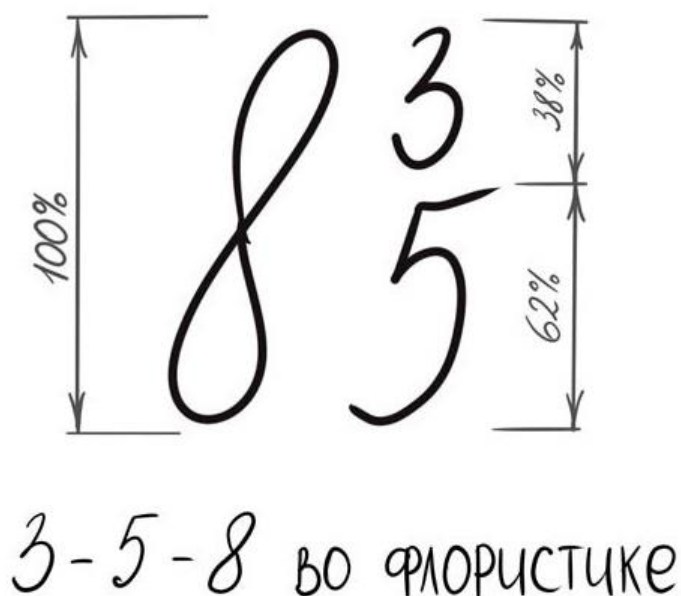
Рис.2. Числа Фибоначчи

Продemonстрируем применение правил золотого сечения и чисел Фибоначчи на примере двух разных композиций.